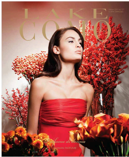
LAKE COMO LIFESTYLE MAGAZINE Winter 2011 - n. 27